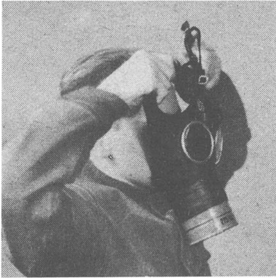
Bild 1. Fatta i sidobanden. Böj huvudet något bakåt och skjut hakan in i ansiktsskyddet.

fastslås endast genom individuell provning och tillpassning. Ansiktsskyddet skall utan veckbildning sluta tätt runt ansiktet, men ej heller ge något besvärande tryck, då i annat fall utandningen försvåras. Tätningen vid tinningar och haka måste särskilt beaktas. Vid val av storlek å gasmask bör tillses att tillräckligt synfält erhålles.