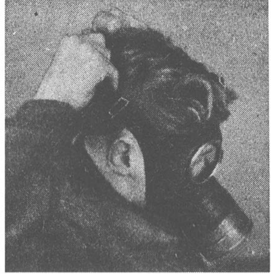
Bild 5. Rätt sätt för gasmaskens avtagande.