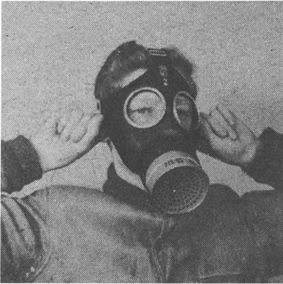
Bild 2. Jämka kanterna så att de ligga slätt.